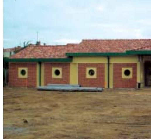
Vue de la structure multi-accueil depuis la rue de la Loubatière.

La Municipalité est consciente des problèmes de garde rencontrés par les parents des communes environnantes, seul un projet intercommunal pourra leur apporter une solution.