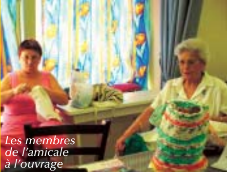
Les membres de l'amicale à l'ouvrage

La municipalité soutient l'activité de l'Amicale par la mise à disposition des locaux, le paiement des factures d'eau, d'électricité, et de chauffage ainsi que par le versement d'une subvention annuelle.