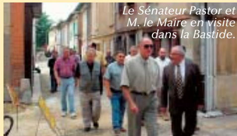
Le Sénateur Pastor et M. le Maire en visite dans la Bastide.

La ville a reçu le Prix Départemental des Rubans du Patrimoine pour les travaux de réhabilitation réalisés dans la Bastide.