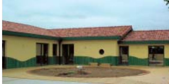
La cour de la nouvelle crèche halte-garderie