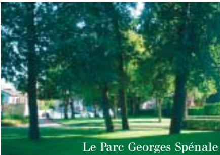
Le Parc Georges Spénale

• Renforcer notre image de ville à la campagne, en réservant des "îlots de verdure" à l'intérieur de la cité , en créant des espaces verts traversant et traversés où se concentreront des jeux, activités, afin de redonner un centre de vie à certains quartiers.