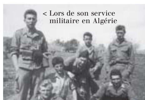
< Lors de son service militaire en Algérie

P.O. : C'est encore mon goût des contacts humains et mon ouverture aux autres qui m'aident dans cette tâche parfois ingrate mais toujours exaltante.