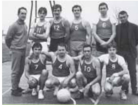
Avec l'équipe de Basket de Balma. (N°6)

P.O. : Le plus important des loisirs à mes yeux sont les réunions de famille. Depuis ma prime enfance tous les dimanches sont consacrés à ces réunions auxquelles j'accorde beaucoup d'intérêt.