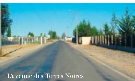
L'avenue des Terres Noires

• Aménager les entrées de ville. Le fait que les usagers de l'autoroute, de la D630 ou de l'ancienne RN88, décident de quitter leur itinéraire pour rentrer dans la ville, représente un réel enjeu économique.