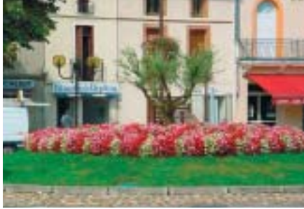
Saint Sulpice, ville verte et fleurie...