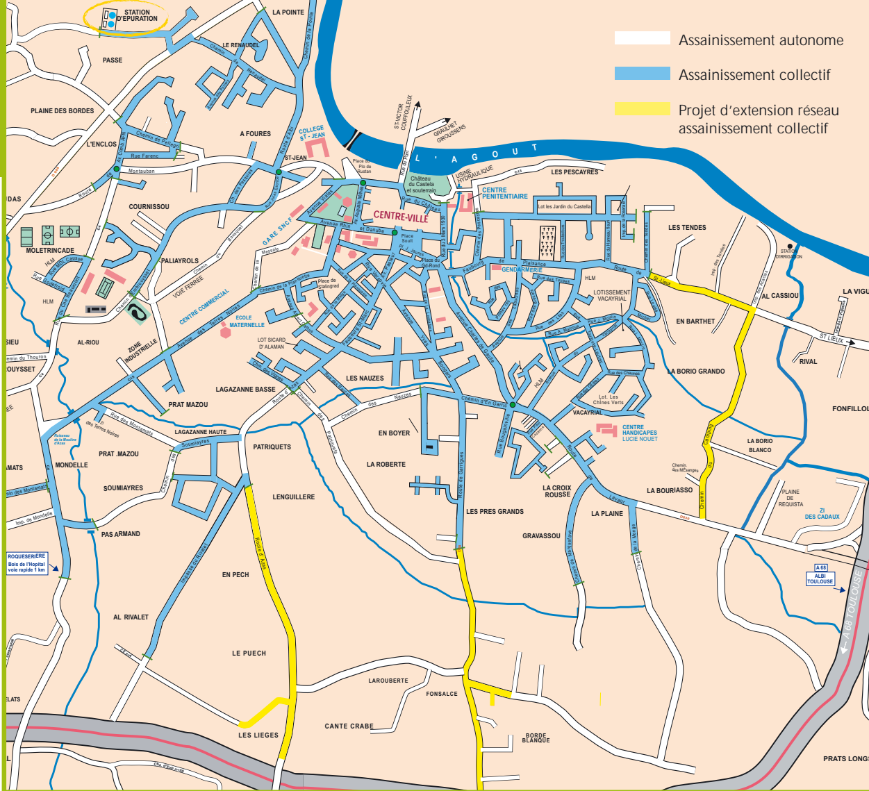
Carte de zonage d'assainissement de la Commune.

▼ L'unité d'auto-contrôle de la station d'épuration analyse l'eau avant d'être rejetée dans l'Agout.