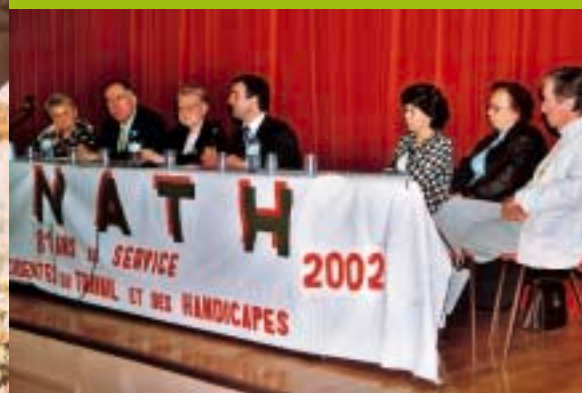
▼ En réunion avec M. le Maire.