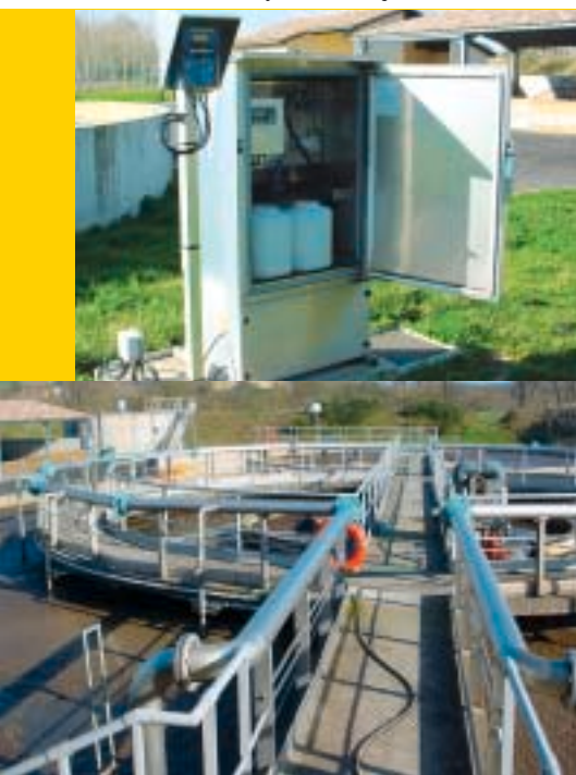
▲ La station d'épuration, plaine de Bordes.

▼ L'unité d'auto-contrôle de la station d'épuration analyse l'eau avant d'être rejetée dans l'Agout.