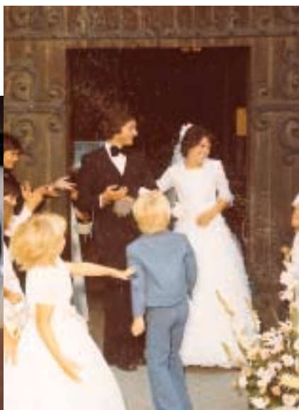
◀ Souvenir du mariage : La sortie de l'Eglise de St Sulpice.