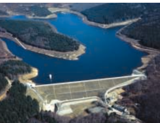
▲ La retenue de la Galaube.

A.P. : Le S.I.E.M.N. assure la distribution publique de l'eau potable sur le territoire de 49 communes réparties sur 5 cantons dans le sud du département du Tarn.