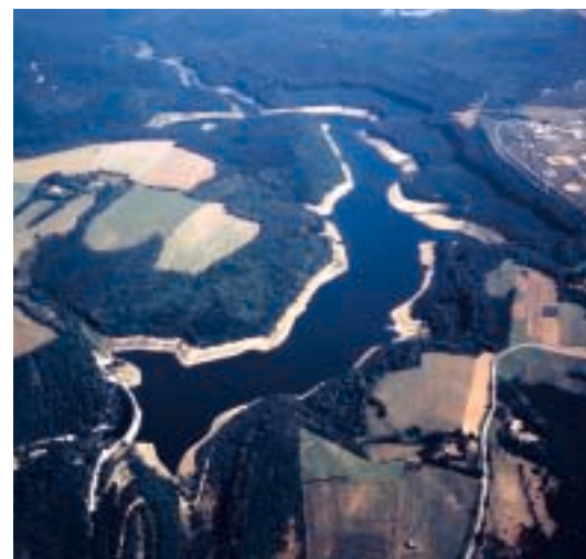
▼ La retenue des Cammazes