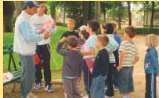
Course d'orientation des enfants du centre de loisirs.