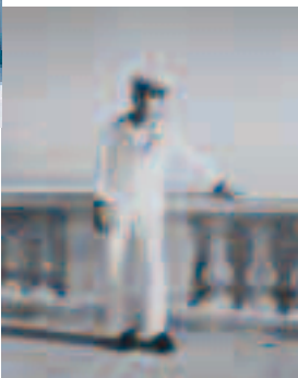
Lors d'une escale en Corse

L.C. : De la Dordogne au Tarn quel est votre itinéraire ?