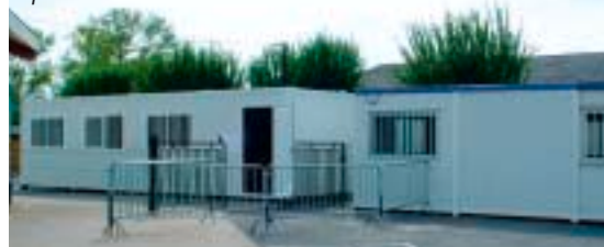
Structures provisoires à la maternelle pour une meilleure rentrée.

familles par nos services leur précisant qu'une réponse définitive ne leur sera donnée qu'après la rentrée, suivant l'avis de la Directrice et les réajustements de rentrée. J'invite donc ces parents à prévoir dès à présent une solution de garde alternative.