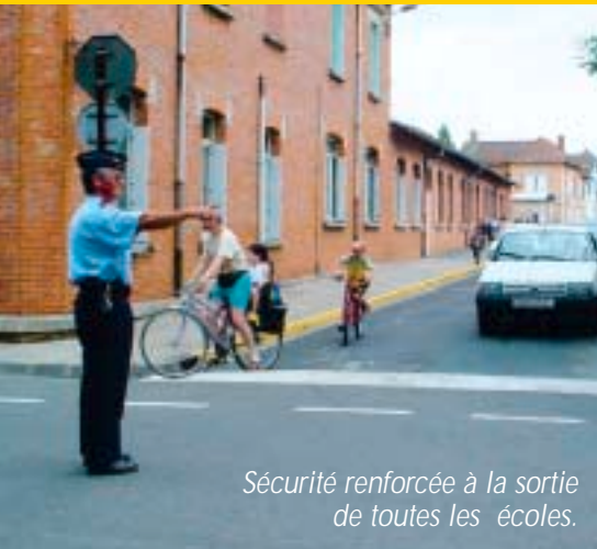
Sécurité renforcée à la sortie de toutes les écoles.

Mais notre démarche d'anticipation ne sera efficace que si l'Inspection Académique ouvre les postes d'enseignants nécessaires au fonctionnement de ces deux nouvelles classes. La balle est aujourd'hui dans leur camp. Espérons que la décision interviendra avant la rentrée.