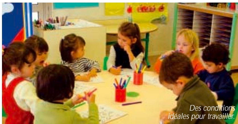
Des conditions idéales pour travailler.