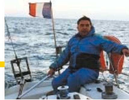
À la barre au large de Sète.

Maire Adjoint chargé de l'Urbanisme et du Cadre de Vie