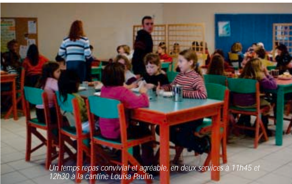
Un temps repas convivial et agréable, en deux services à 11h45 et 12h30 à la cantine Louisa Paulin.

J.D. : A notre niveau, tout a été fait puisque nous créons deux nouvelles salles de classe. L'achat d'un algeco pour l'Ecole Maternelle Louisa Paulin et l'aménagement de l'actuelle salle de peinture à l'Ecole Elémentaire Marcel Pagnol, permettront d'accueillir les enfants de la Commune. Sont également prévus : l'achat du mobilier, des fournitures, ainsi qu'un poste d'ATSEM (Agent Territorial Spécialisé des Ecoles Maternelles).