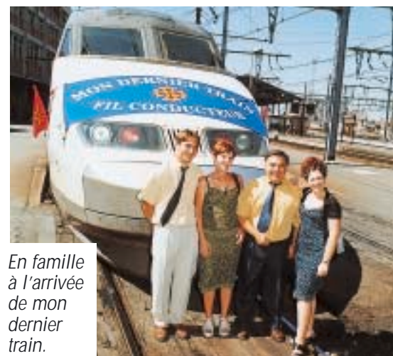
En famille à l'arrivée de mon dernier train.

L.C. : Merci Monsieur Vergnaud pour votre accueil et bonne continuation !