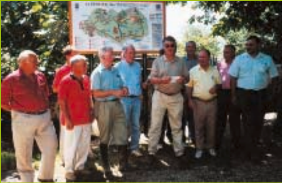
Lors de l'inauguration des sentiers de randonnées