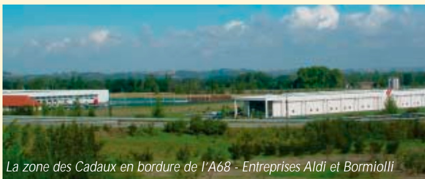
La zone des Cadaux en bordure de l'A68 - Entreprises Aldi et Bormioli

Sans ces deux approches, très vite, on pourrait nous reprocher de ne pas fonctionner suffisamment par manque de COMPÉTENCES TRANSFÉRÉES: le temps des décisions est donc là afin de fédérer nos ambitions légitimes.