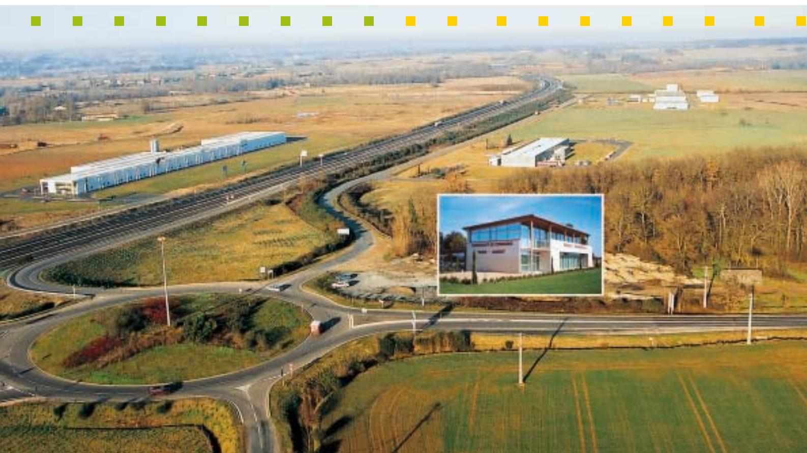
La zone des Cadaux en bordure de l'A68 - L'Espace Ressources