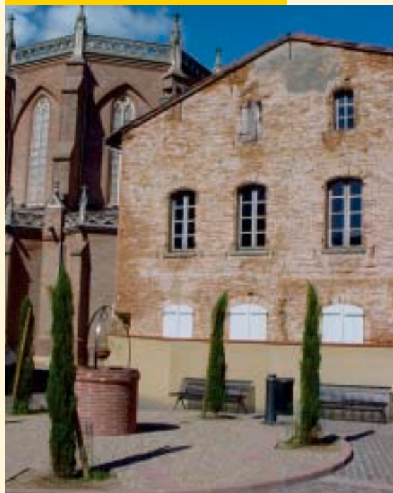
Place Jeanne d'Arc dans la Bastide

Et pour finir, le Président de la Communauté de Communes ne doit surtout pas devenir un «SUPER-MAIRE». Nous sommes persuadés que, pour sa part, l'actuel Président ne se veut pas, ne se pose pas comme tel... Son seul souci est le CONSENSUS pour mener à bien des projets fédérateurs avec équité.