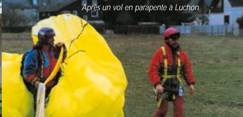
Après un vol en parapente à Luchon