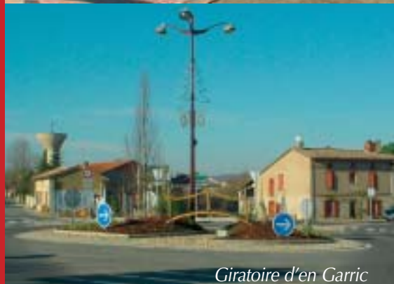
Giratoire d'en Garric