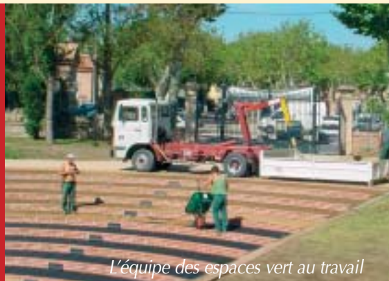
L'équipe des espaces vert au travail

La végétalisation du rond point est terminée, l'aménagement paysager se poursuivra début 2004 pour la création d'un parc contigu au carrefour.