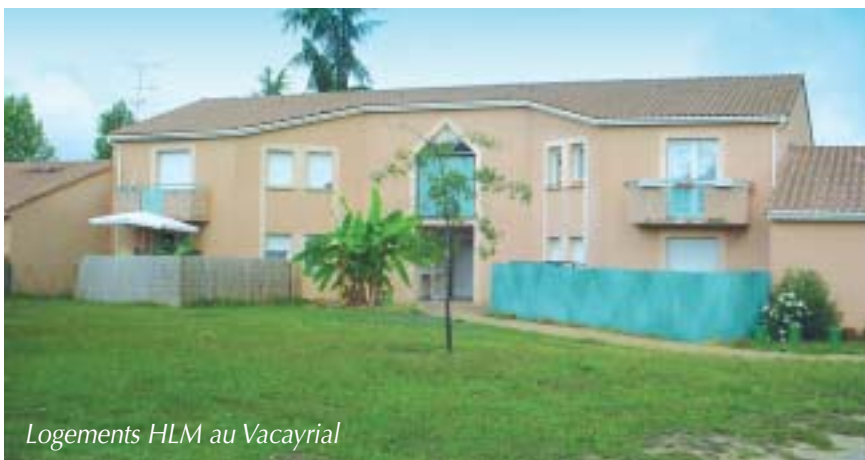
Logements HLM au Vacayrial

➤ Il établit la liste des dossiers de demande de logements H.L.M. (dont le parc comporte à ce jour 157 logements) à proposer en priorité à la Commission d'attribution du secteur de Gaillac.