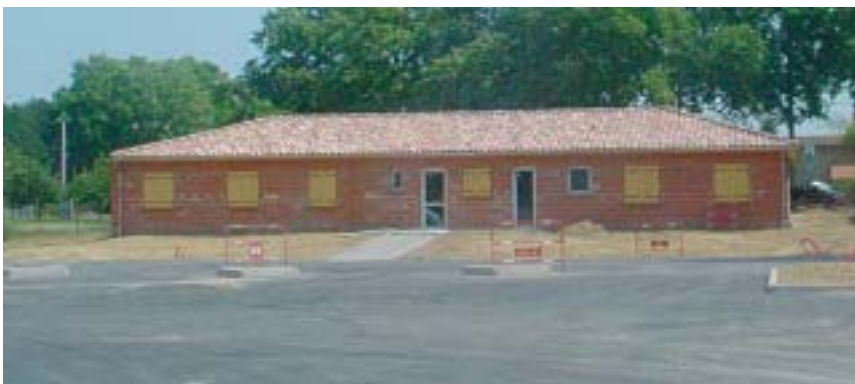
Le chantier de la crèche associative « La Nacelle ».

➤ Il coordonne les actions sociales sur le territoire communal en maintenant un dialogue permanent avec les divers acteurs sociaux de la Commune (assistantes sociales, A.D.M.R., Restos du Cœur ; Croix Rouge...). Ainsi la mise en place du plan canicule lui a été confié.