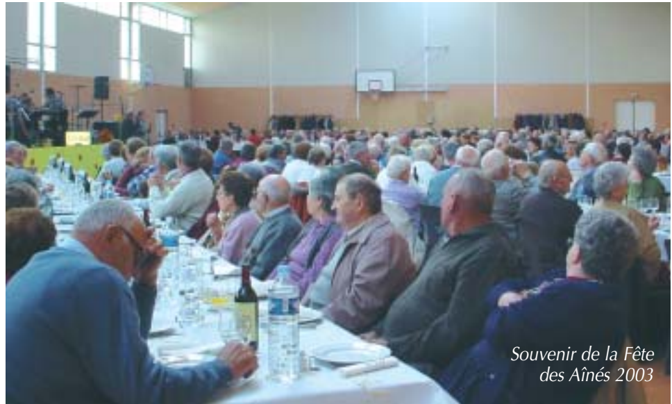
Souvenir de la Fête des Aînés 2003

➤ Il organise la Fête des Aînés qui regroupe chaque année à l'automne plus de 400 convives.