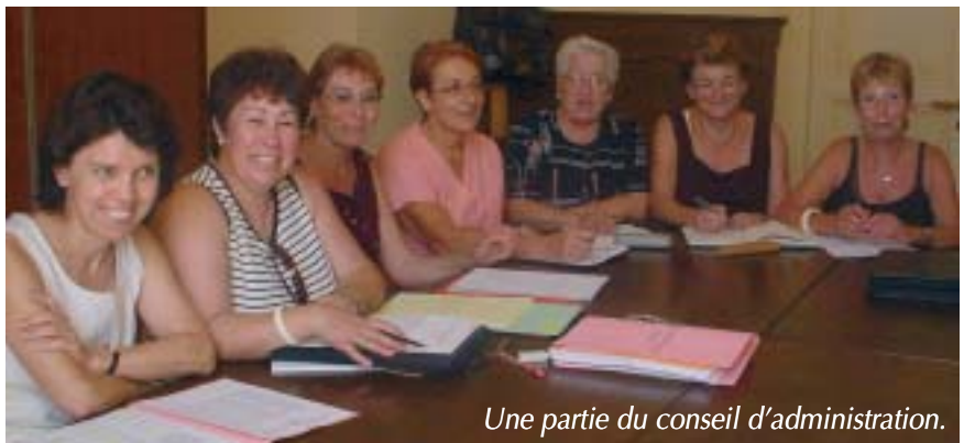
Une partie du conseil d'administration.