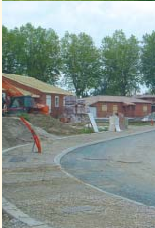
Lotissement "Les Grands Chênes"