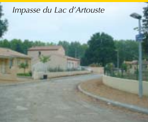
Impasse du Lac d'Artouste