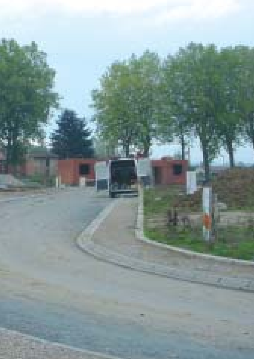
Impasse du Lac d'Artouste