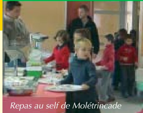
Repas au self de Molétrincade

Le groupe SCOLAREST assure depuis la rentrée la fourniture des repas en liaison froide dans les différents lieux de restauration scolaire de la ville. Le prix du repas est fixé à 2,44€ (prix unitaire par élève). La différence entre le coût réel du repas et celui facturé aux parents est pris en charge par la Commune soit 1,19€ pour les plus grands et 1,09€ pour les petits.