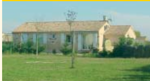
Lotissement "Les Chênes Vert"

Toutes ces procédures et ces démarches durent en moyenne une année.