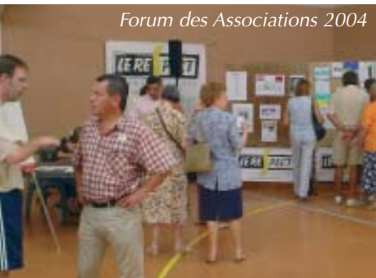
Forum des Associations 2004