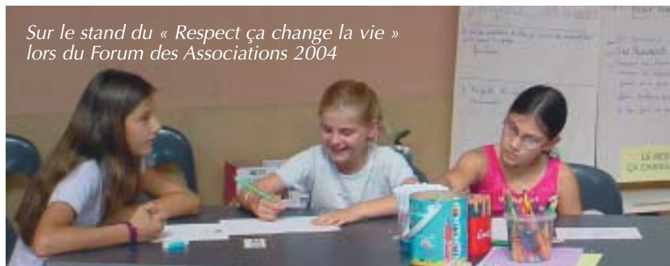
Sur le stand du « Respect ça change la vie » lors du Forum des Associations 2004