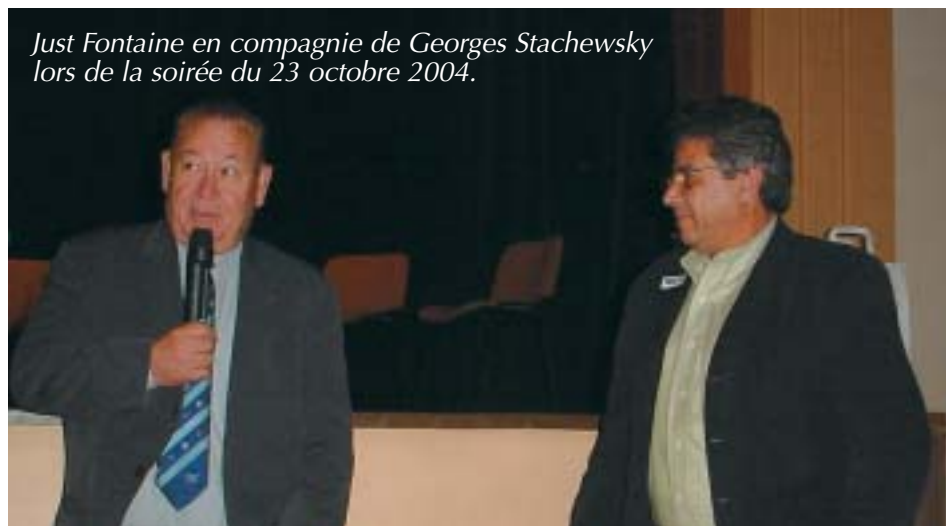
Just Fontaine en compagnie de Georges Stachewsky lors de la soirée du 23 octobre 2004.